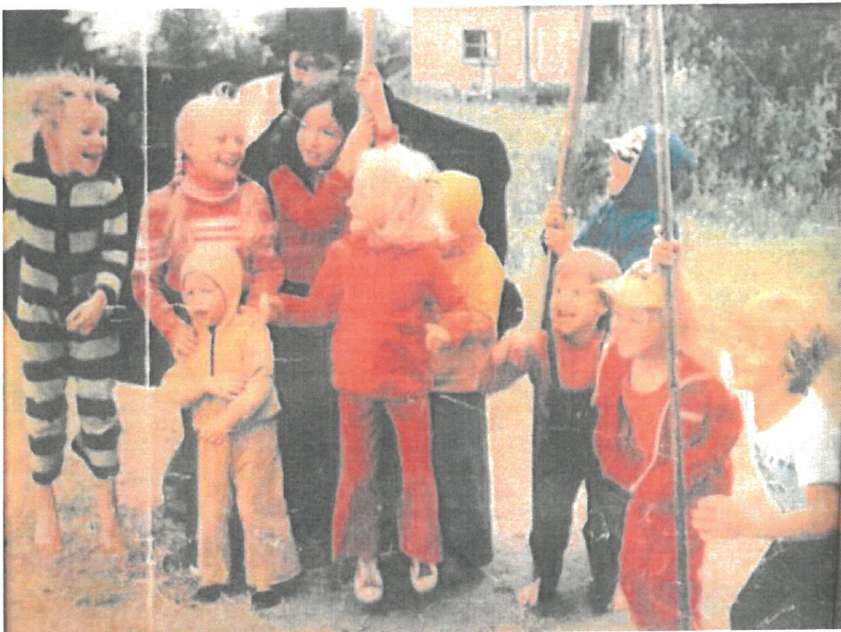
Herra Huu elokuvan lapsinäyttelijöistä suuri osa oli Joutsijärveltä. Kuva Hautaniemestä v. 1973.

Todisteena matkailijoiden kiinnostuksesta on se, että joka kesä kotimaan ja ulkomaan matkailijoita on tavattu pitämässä matkataukoa ja jopa yöpymässä matkailuautossaan Hautaniemen kärjessä olevalla uimarannan pysäköintipaikalla.