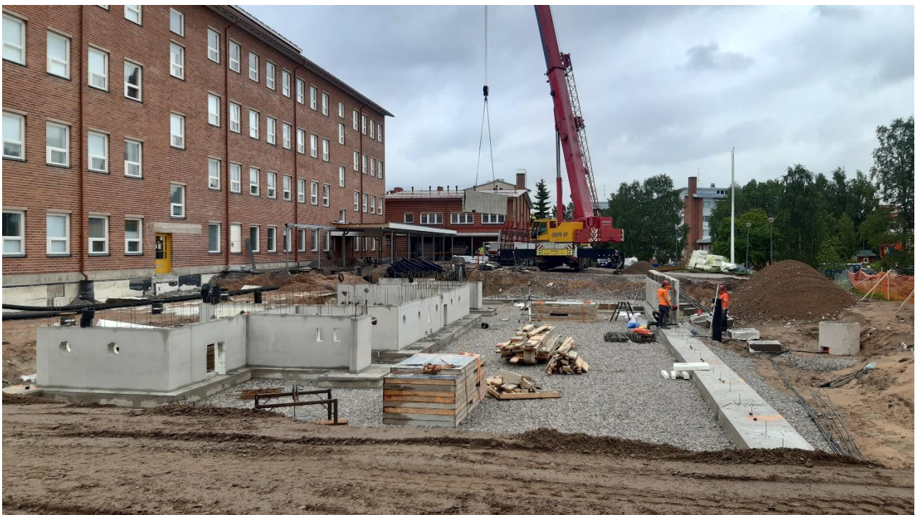
Kuva 2: Koulukampuksen investointikohteen toteuttaminen vuosina 2020–2021

Tilapalvelujen toimintaa ohjaa osaltansa myös kaupunginvaltuuston hyväksymä kiinteistöohjelma 2023–2026.