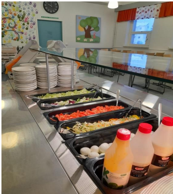
Kuva 3: Aterialinjasto Hillatien koulukampuksella

Ruokapalvelut toimivat yhdessä tuotantokeittiössä, Seminaarikadun 10 rakennuksessa. Volyymiltaan suurimmat jakelukeittiöt sijaitsevat Hillatien koulukampuksella sekä Jyväskylänpuiston päiväkodilla. Ruokapalvelujen osalta valmistaudutaan vuonna 2024 suunnitelluksi valmistuvaan keskuskeittiöön.