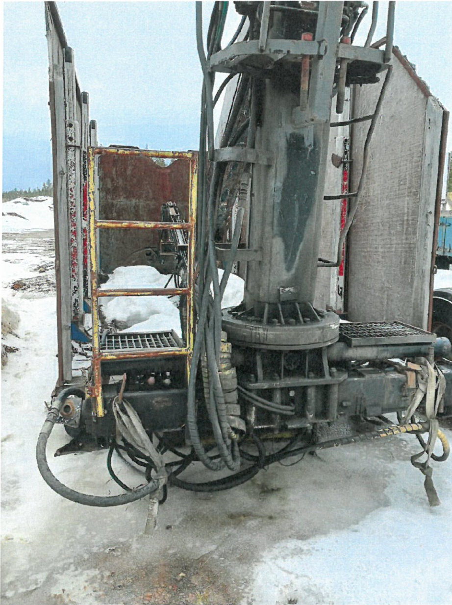
Kuva 3. Sama kontti kuin kuvassa 2.