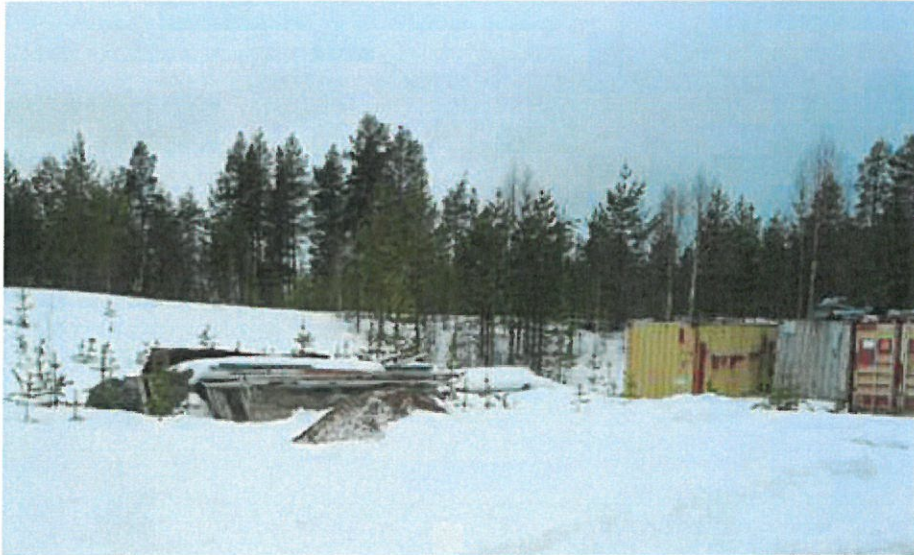
Kuva 6. Kiinteistölle varastoituja kontteja, sekä teollisuushallin osia.