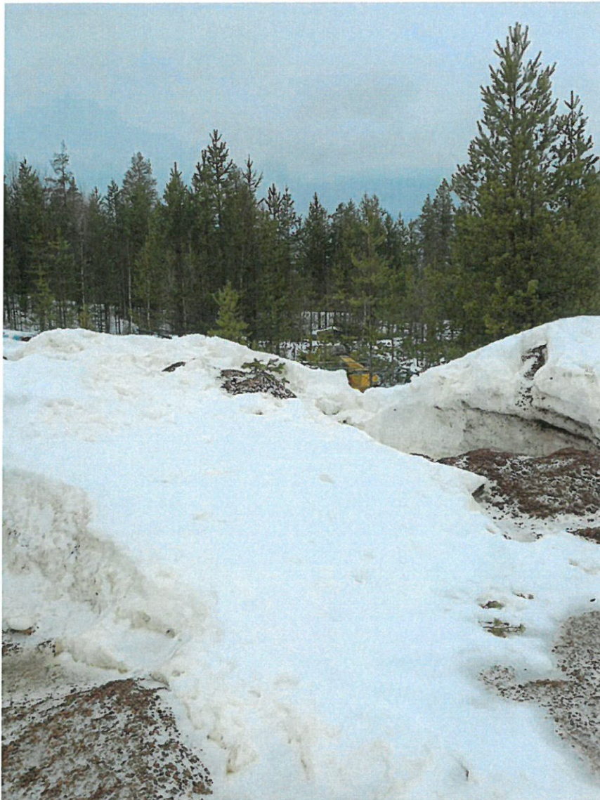
Kuva 4. Puretun teollisuushallin osat, jotka ovat jääneet metsittyneen alueen sisälle.