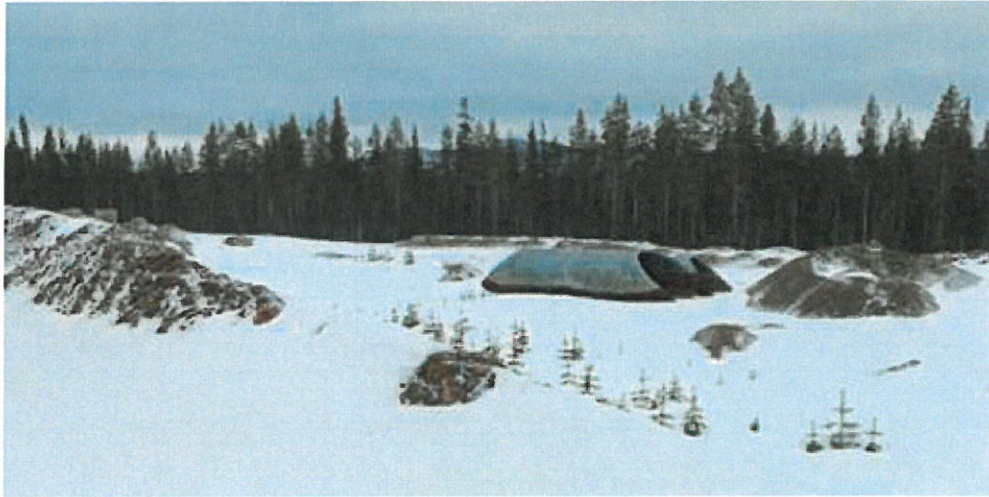
Kuva 10. Kaksi siltarumpua lisää. Kiinteistöllä yhteensä 3.