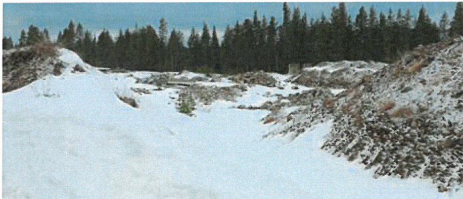
Kuva 11. Taustalla näkyy betonielementtejä oikealla ja vasemmalla muuta betonijätettä.