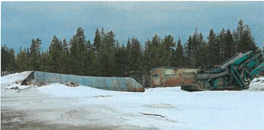
Kuva 7. Kiinteistölle tuotu murskain oikealla, sen takana kontti ja vasemmalla siltarumpu.