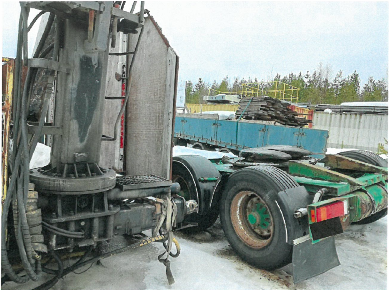
Kuva 2. Peräkärryn viereen tuotu kontti, jossa metsäkoneen koura.