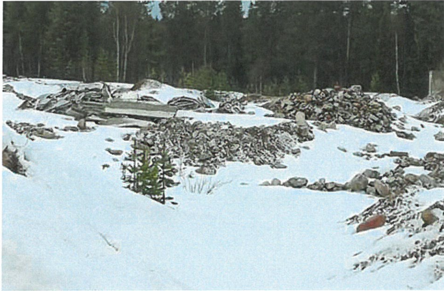
Kuva 8. Osaksi murskattua betonijätettä, sekä maa-aineksia.