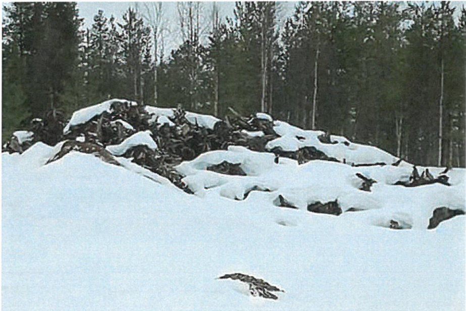
Kuva 9. Kantoja.