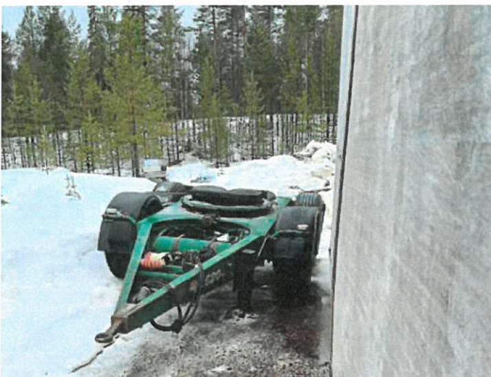
Kuva 1. Kiinteistölle tuotu peräkärri.

Veljekset Karjalainen Oy ei ole noudattanut määräystä jätteiden siivoamiseksi pois kiinteistöltä Keskipyhä. Tarkastuksella kiinnitettiin huomiota myös siihen, että toiminnan harjoittaja on varastoinut kiinteistölle jätteiden lisäksi nyt myös raskasta työkalustoa, esimerkiksi murskain, perävaunu ja metsäkone. Tarkastuksen yhteydessä otetut kuvat (1-11) esitetty alla.