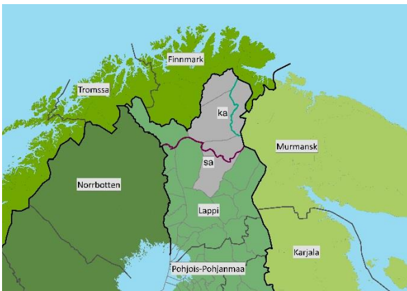
Kuva 1. Pohjois-Lapin maakuntakaava-alue ja vaikutusalueet.

Lapissa maakuntakaavoitus etenee osa-alueittain. Pohjois-Lapin maakuntakaava-alueeseen kuuluvat Inari, Sodankylä ja Utsjoki. Vaikutusaluetta on Pohjois-Lapin lisäksi koko Lapin maakunta sekä Norjan ja Venäjän lähialueet. Pohjois-Lapin maakuntakaava-alueesta saamelaiden kotiseutualueeseen (Laki saamelaiskäräjistä 17.7.1995/974) kuuluvat Inarin ja Utsjoen kuntien alueet sekä Sodankylän kunnassa sijaitseva Lapin paliskunnan alue. Kolttalaue sijoittuu Inarin kunnan itäosaan.