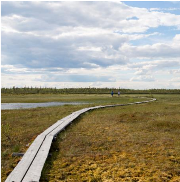
Kuva 4: Aapasuo Sodankylässä

Pohjois-Lapissa poroelinkeino on maankäyttäjää maa- ja metsätalousvaltaisilla alueilla, luontaistalous- ja poronhoitovaltaisilla alueilla, metsä- ja poronhoitovaltaisilla alueilla, erämaa-alueilla sekä suojelualueilla. Poroelinkeinoon harjoittamista ohjaa poronhoitolaki. Maakuntakaavassa poronhoidon toimintaedellytyksiä turvataan ensisijaisesti kaavamääräyksillä, jotka tulee ottaa huomioon alueidenkäytön yksityiskohtaisemmassa suunnittelussa ja toteuttamisessa. Poronhoidon toimintaedellytysten turvaaminen on yksi keskeisimmistä kysymyksistä, kun metsien monikäyttöä eri tasoilla suunnitellaan.