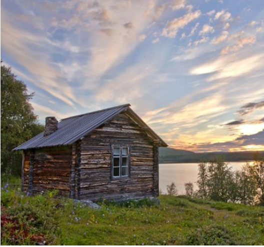
Kuva 5:

lailla tai maankäyttö- ja rakennuslain nojalla suojeltuja tai suojeltavaksi tarkoitettuja valtakunnallisia alueita tai kohteita.