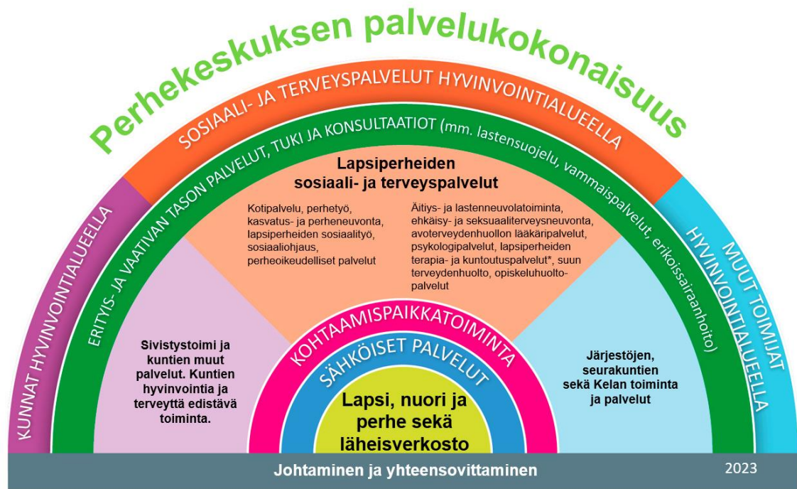
Kuvio 1. THL: Perhekeskuksen palvelukokonaisuus